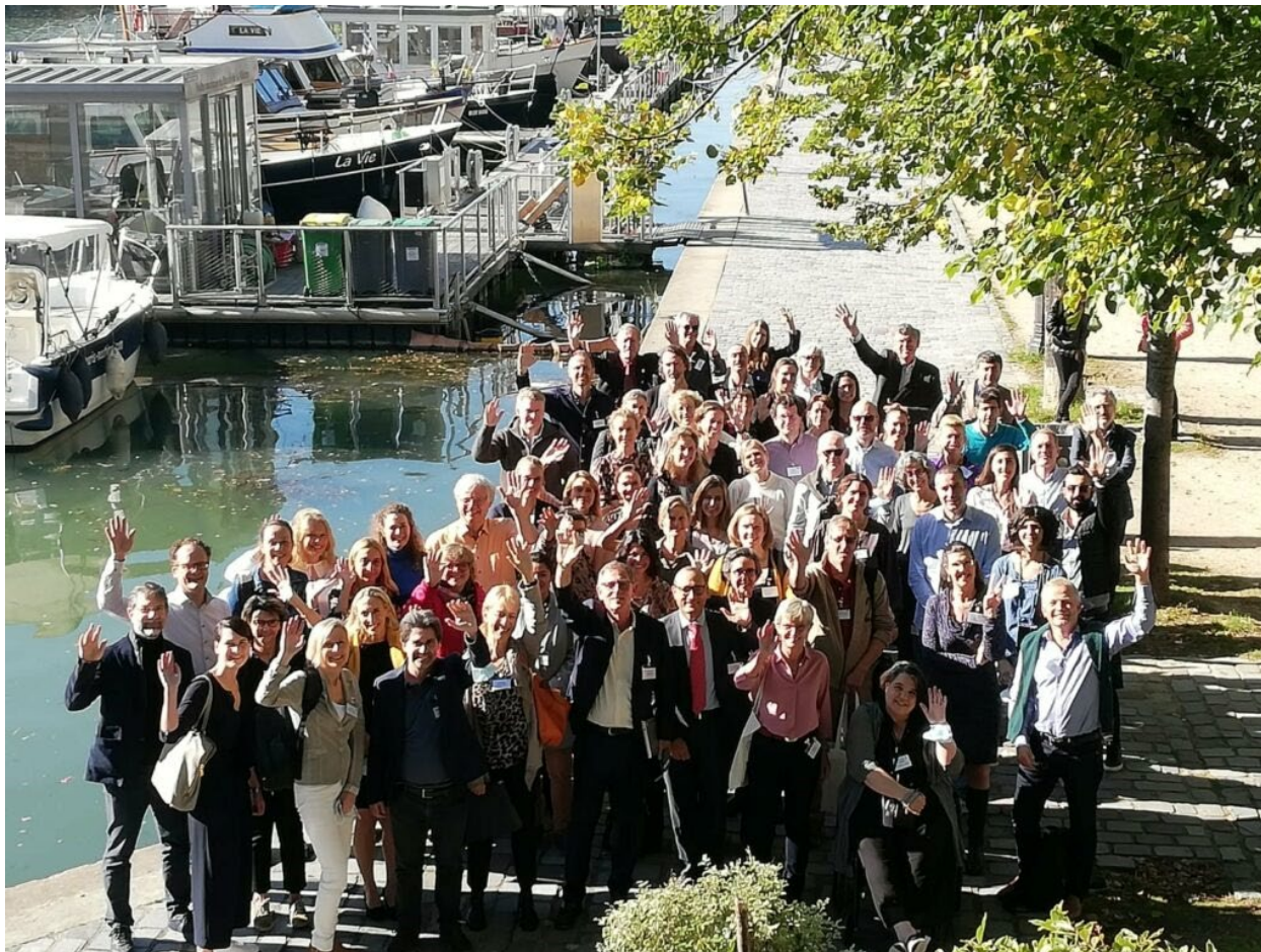
Foto: VASCERN Days 2021 Parijs

uit dit netwerk is in 2020 gestart met de voorbereidingen van 'het VASCA-magazine' dat ook op Europees niveau tot doel heeft om patiënten en specialisten voor te lichten over de laatste ontwikkelingen op het gebied van diagnose, behandeling en onderzoek van aangeboren vaatafwijkingen.